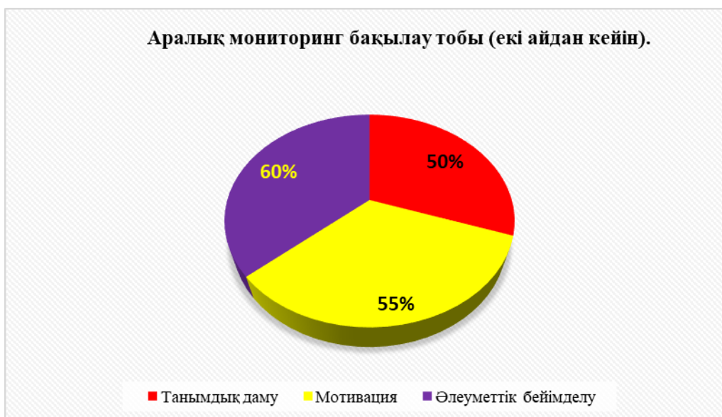
2 диаграмма Аралық мониторинг (екі айдан кейін).