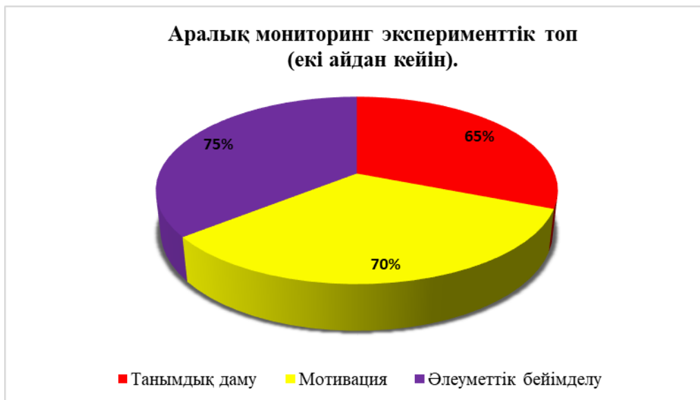
1. диаграмма Аралық мониторинг (екі айдан кейін)